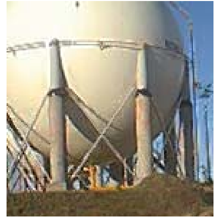
Esfera almacenamiento de GLP (posee sus "patas" ignifugadas con cemento)