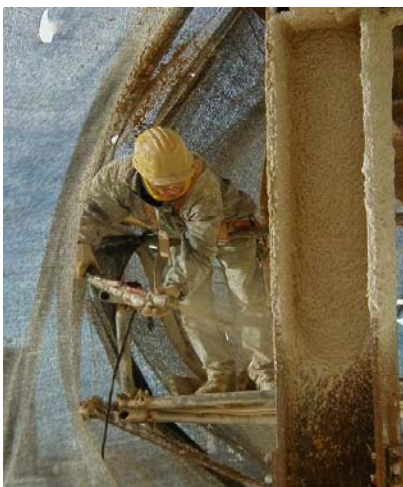
Aplicación de pintura intumescente

El uso de materiales seguros y el análisis de riesgos que implica toda actividad o proceso permitirán obtener como resultado una combinación positiva de disposiciones que preserven la vida humana y sus bienes.