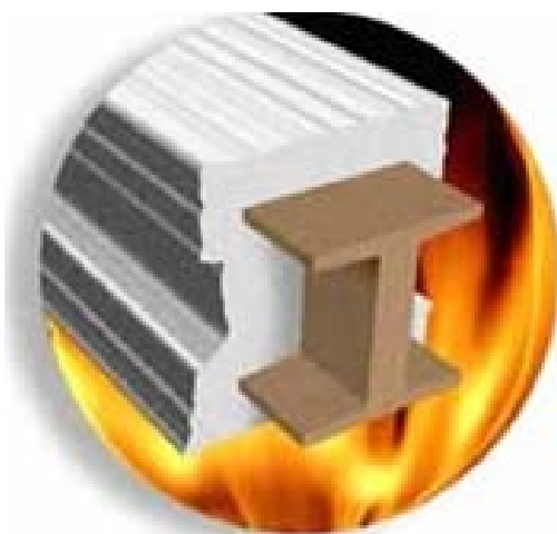
Expansión de la pintura intumescente en un perfil de acero debido al efecto del calor

Los recubrimientos con pinturas intumescentes constituyen un sistema de protección pasiva.