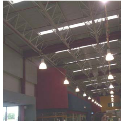
Estructuras metálicas portantes, en paredes y techos de un supermercado, carentes de igniugación

Como aspectos negativos mencionamos que, si bien el acero es incombustible, presenta escasa resistencia al calor de un incendio: son más vulnerables frente al fuego que las estructuras de hormigón armado. Al estar en contacto con un foco de calor los metales aumentan su temperatura rápidamente; simultáneamente el aumento de temperatura disminuye su resistencia.