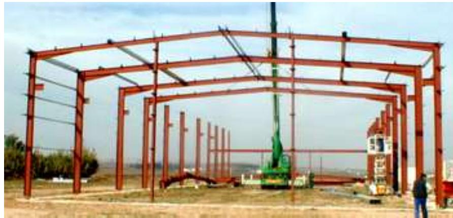
Típica estructura de acero (aquí: perfiles de alma llena), sin ignifugación

La protección por IGNIFUGACION de las estructuras metálicas puede realizarse de diversas formas: recubrimientos con hormigón armado, placas de fibrosilicatos, morteros proyectables, ladrillos y también con pinturas intumescentes. Algunos ocultan la estructura, mientras que otros preservan su estética, a la vez que otorgan un tiempo mayor de resistencia al fuego.