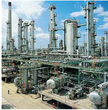
Típicas estructuras metálicas presentes en las industrias química, petroquímica, petróleo/gas