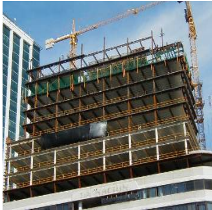
Torre edificio Diario La Nación de Buenos Aires (estructura metálica protegida por mortero liviano para fuego celulósico).